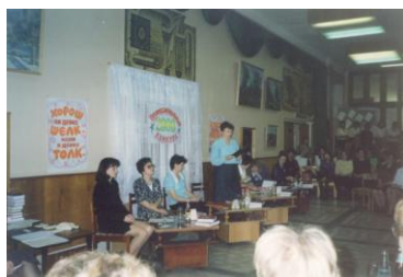
Конкурс рекламы своего отдела.

В мае в рамках празднования Дня библиотек прошел профессиональный конкурс начинающего библиотекаря (см. Приложение 2).