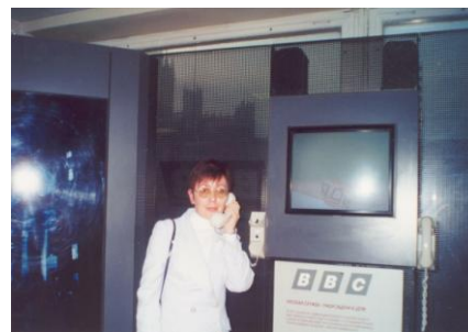
Здесь можно прослушать информационные новости любой программы канала Bi-bi-Ci

Программа стажировки была очень насыщена и принесла несомненную пользу всем тем, кто принял в ней участие.