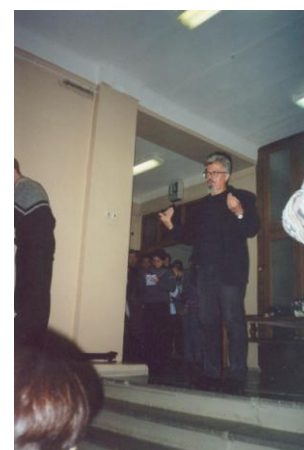
Э.Лимонов о своих планах...